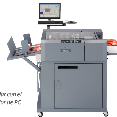
DC-616 PRO estándar con el software Controlador de PC

* El brazo para la PC no está incluido y debe adquirirse como opcional. La PC no está incluida, la fotografía es simplemente ilustrativa.