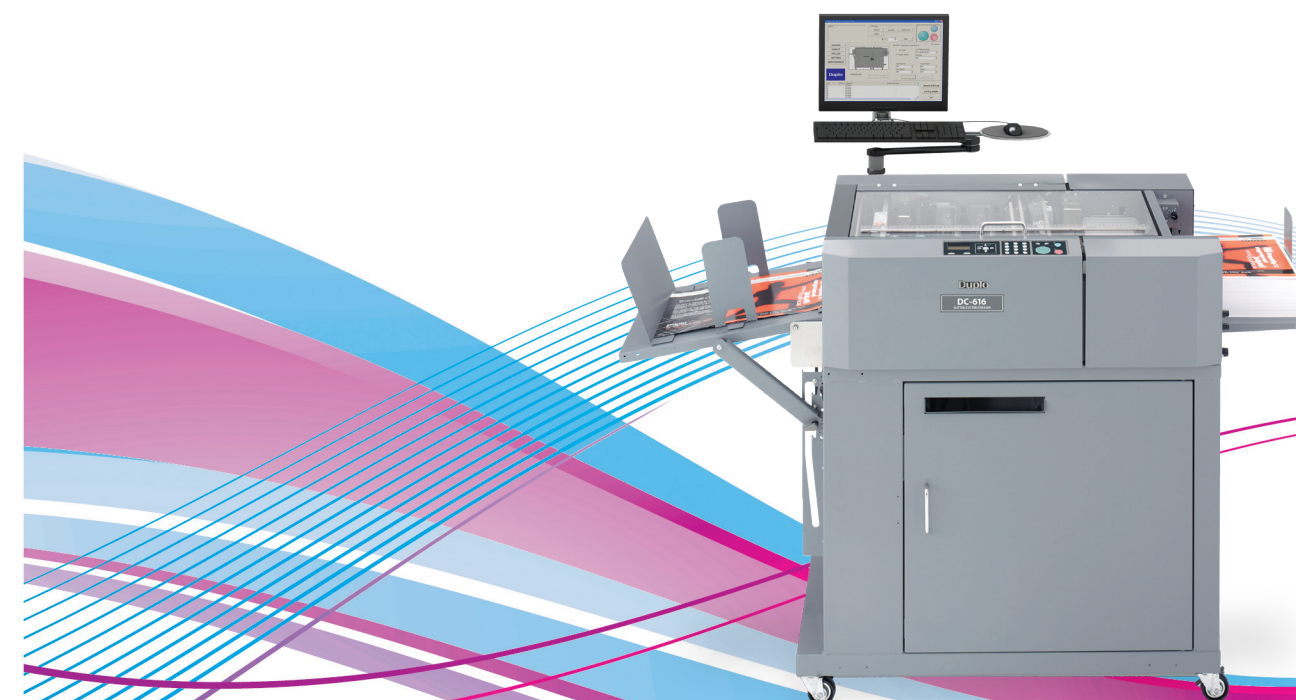
DC-616 Pro (PC y brazo de PC vendido por separado)

Como parte de un programa de mejora continua, las especificaciones están sujetas a cambio sin previo aviso.